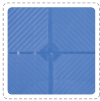
>> 全方位防滑丝纹理