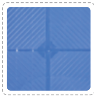
>> 全方位防滑丝纹理